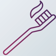
Hygieneartikel Seife, Unterwäsche, Zahnbürste, ...