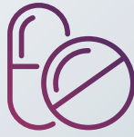
Medikamente und Erste-Hilfe-Material