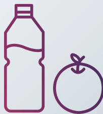
Verpflegung für 1 Tag Wasser, Lebensmittel