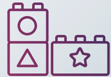
Spielzeug für Kinder